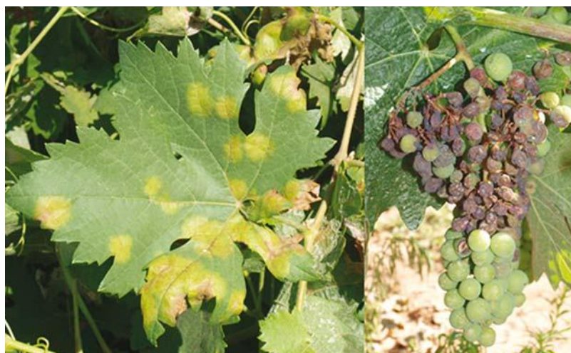
Figura 2. Síntomas causados por el mildiu en hoja y racimo de vid (Foto tomada por José Luis Ramos Sáez de Ojer, Consejería de Agricultura, Gobierno de La Rioja).

La mayoría de las variedades de Vitis vinifera son altamente susceptibles a la infección