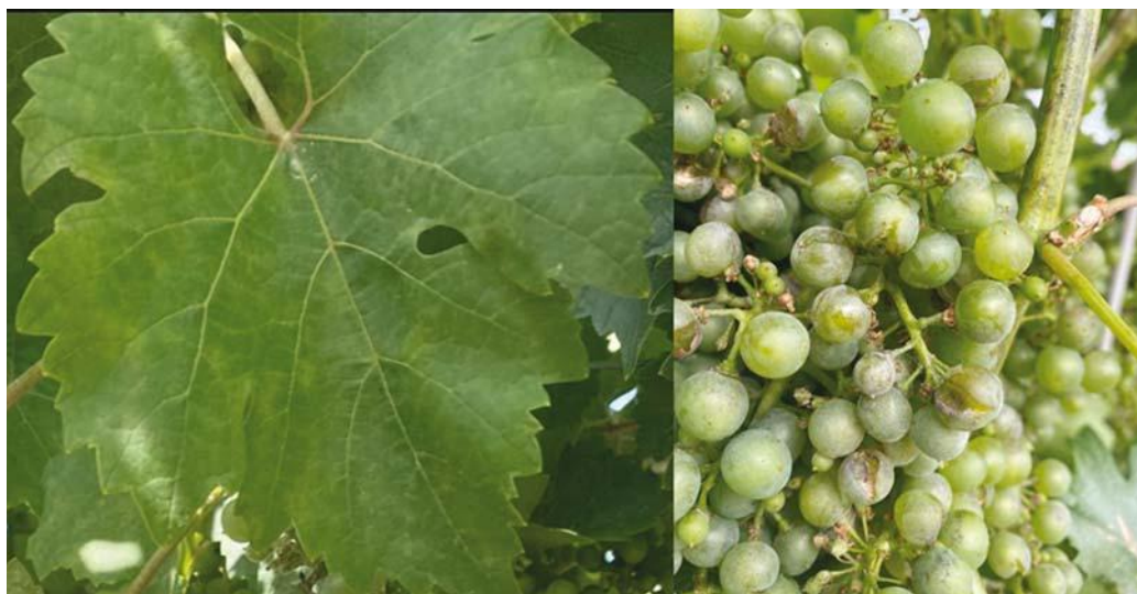
Figura 1. Síntomas causados por el oídio en hoja y racimo de vid.

es doctora ingeniera agrónoma por la Universidad Politécnica de Madrid. Actualmente es investigadora titular adscrita al Instituto Murciano de Investigación y Desarrollo Agrario y Medioambiental (IMIDA), y responsable del equipo de Mejora Genética Molecular. Su investigación se centra en la mejora genética de uva de vinificación mediante cruzamientos dirigidos y una selección asistida por marcadores moleculares, con dos objetivos principales: la obtención de variedades resistentes a factores abióticos, como la sequía y las altas temperaturas, y a factores bióticos, como el oídio y mildiu.