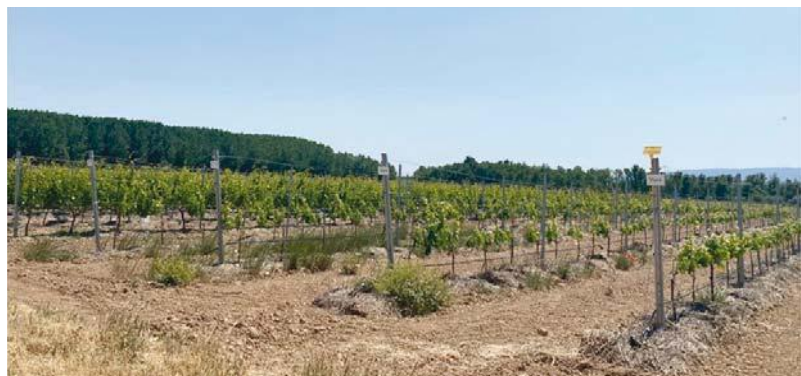
Figura 4. Parcela de ensayo de PIWI en La Rioja (Foto tomada por Sara I. Blanco González, Breedvitis-ICVV).